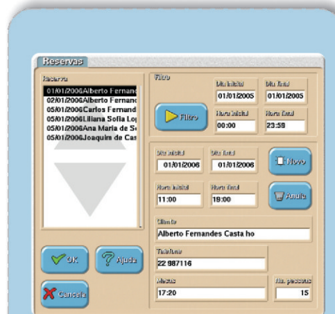
➤ Ecrã nova Reserva de mesas