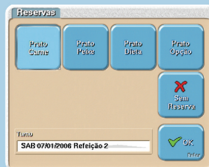
➤ Ecrã reserva de pratos